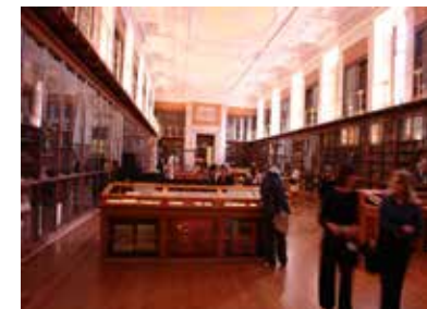
大英博物館の展示室