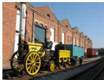
マンチェスター-リバプール鉄道 (イメージ)

マンチェスターは、産業革命の発祥地として、大英帝国の繁栄をささえる大工業地帯でした。オーエン主義者をはじめ、労働組合やチャーチストたちの運動もこの地で盛んになり、多くの権利を獲得して後世に成果をひきついできました。