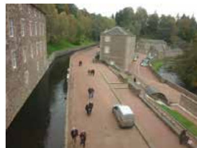
ニューラナーク (現在は博物館になっている)

スコットランドの工場経営者ロバートオーエンは、労働意欲を失い、犯罪や売春に走る少女たちのために世界初の幼児教育施設を工場内に設置し、労働意欲を高め、高い生産性を実現しました。また社会主義による工場運営で利益の平等な分配を行うユートピアを建設しようとアメリカに渡り、ニューハモニー村を建設しますが、失敗します。後にマルクスやエンゲルスは、これらの資本家主導の社会改造主義を空想的社会主義と呼び、労働者が主体となって、資本主義のしくみそのものを改革する必要性を訴えました。このツアーでは、天気が良ければ、クライドの滝へのハイキングを実施し、専門ガイドは同行しませんが、博物館では、日本語ライドに乗ってオーエンの実践を学びます。