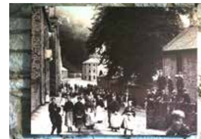
ニューラナーク (オーエンの時代)

スコットランドの工場経営者ロバートオーエンは、労働意欲を失い、犯罪や売春に走る少女たちのために世界初の幼児教育施設を工場内に設置し、労働意欲を高め、高い生産性を実現しました。また社会主義による工場運営で利益の平等な分配を行うユートピアを建設しようとアメリカに渡り、ニューハモニー村を建設しますが、失敗します。後にマルクスやエンゲルスは、これらの資本家主導の社会改造主義を空想的社会主義と呼び、労働者が主体となって、資本主義のしくみそのものを改革する必要性を訴えました。このツアーでは、天気が良ければ、クライドの滝へのハイキングを実施し、専門ガイドは同行しませんが、博物館では、日本語ライドに乗ってオーエンの実践を学びます。