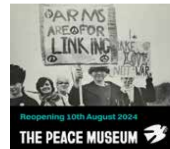
平和博物館のホームページより

世界で初めて平和学を創設し、世界平和の研究を続けるブラッドフォード大学のあブラッドフォードには、一般の人が見学できる平和博物館もあります。現在移転のため休館中ですが、8月にはリニューアルオープンの予定です。現地のツアーに参加して、イギリスの平和学の成果について学びます。日本語のブルーバッジガイドが同行します。