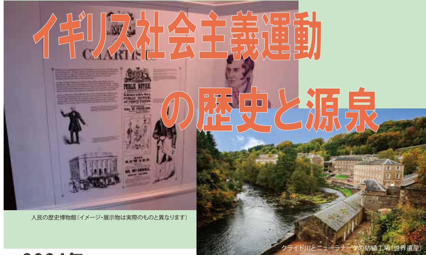
人民の歴史博物館(イメージ・展示物は実際のものとは異なります)