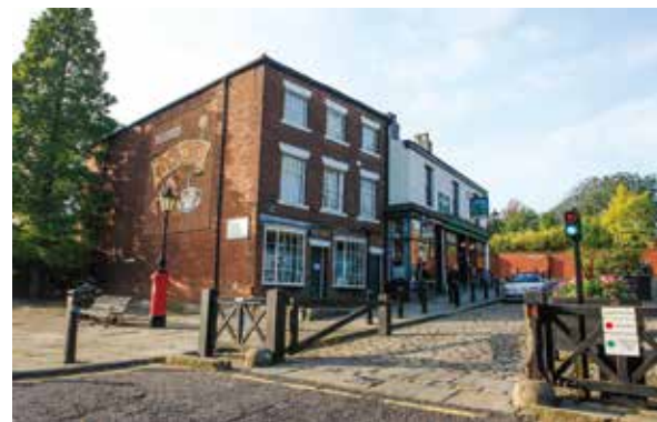
ロッジデールの最初の生協の店

空港使用料/国際観光税/海外空港資料料・燃油付加運賃(航空会社により93,000円~112,000円)が別途かかります。左記は、2024年7月現在のものです。航空券の発券レートにより変動します。その場合は差額を徴収もしくは返金いたします。