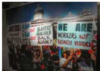
海事博物館の展示 (イメージ)

マンチェスターで生産された繊維製品は、リバプールの港からアフリカに輸出され、その資金を元手に奴隷を入手し、アメリカで奴隷を販売、さらにその資金で、綿花などの原材料を輸入する三角貿易が行われていました。世界遺産のアルバータドックの中の海事博物館には、奴隷制度に関する展示があり、ガイドの案内で見学します。