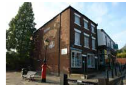
世界初の生活協同組合の店 (ロジデール)

マンチェスター郊外のロジデールでは、労働者がミルクや小麦を安く手に入れるために組織された消費生活協同組合の発祥地があります。生協運動は、その後、イギリス全土、そして世界中に広がり、日本にも、各地に消費生活協同組合ができました。安心・安全な食品を廉価で供給し、運営主体も消費者が担うという民主的な流通システムは、ロジデール原則として、ここで確立したものです。