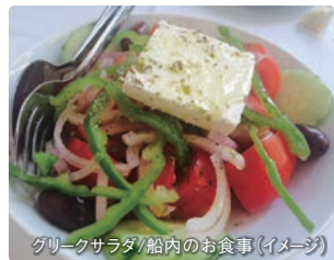
グリーンサラダ/船内のお食事(イメージ)