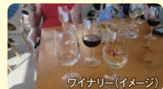
ワイナリー(イメージ)