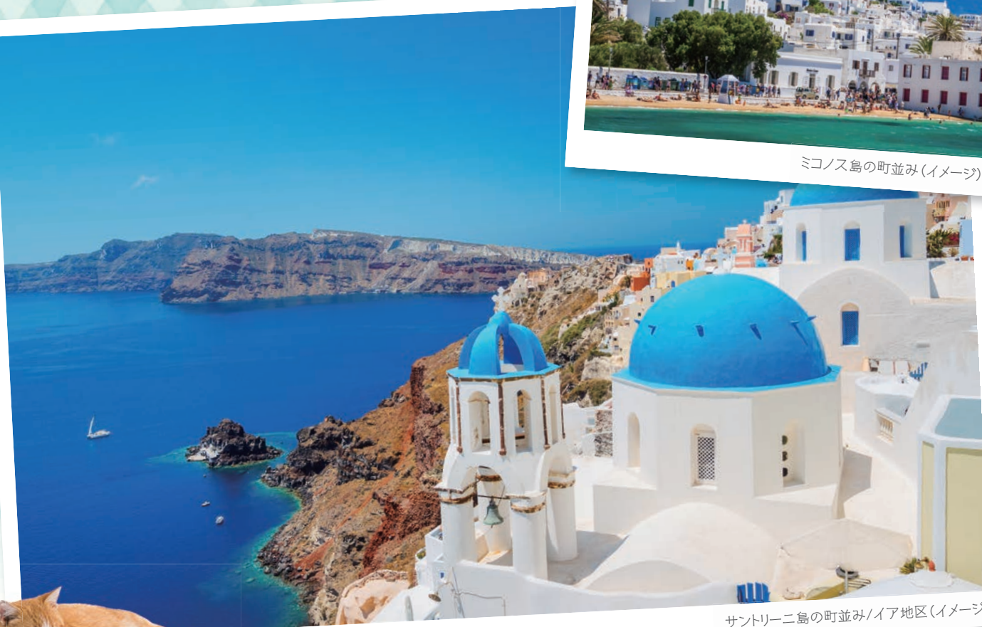
サントリーニ島の町並み/イア地区(イメージ)