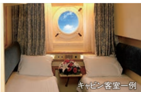
キャビン客室一例