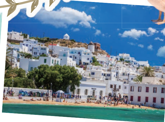
ミコノス島の町並み(イメージ)