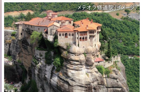
メテオラ修道院(イメージ)