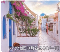
フィラ地区の町並み(イメージ)

紀元前からの歴史と遺跡、火山活動が造りだした切り立った断崖の頂上に、積もった雪のように輝く白壁の家々。エーゲ海リゾートの中で最も人気の高い島です。