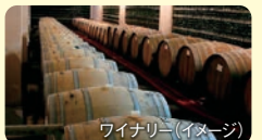
ワイナリー(イメージ)

ご希望のプランをご出発3週間前までに担当までお伝えください。特にご希望をいただかない場合はプラン②をご用意します。