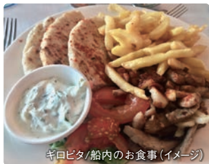
ギロピタ/船内のお食事(イメージ)

様々なギリシャ料理をお楽しみください。クルーズ船内にはレストランが2ヶ所ありビュッフェまたはアラカルトでお楽しみいただけます。(船でのお食事はすべてクルーズ代に含まれます。)