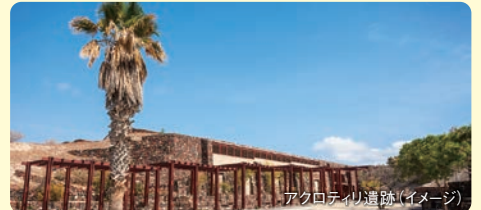
アクロティリ遺跡(イメージ)

アクロティリ遺跡(入場)観光とフィラの町を散策した後、ワイナリーを訪問してのどかなぶどう畑の風景と3種類のワインの試飲をお楽しみいただけます。