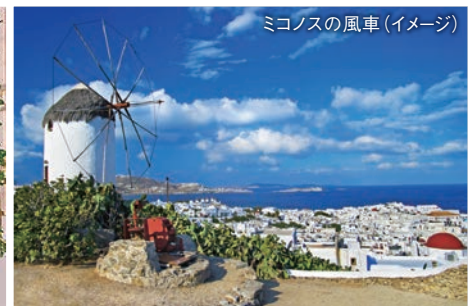
ミコノスの風車(イメージ)