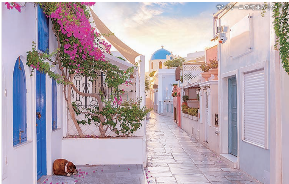
サントリーニの町並み(イメージ)

Minister Plenipotentiary for Economic & Commercial Affairs Embassy of Greece in Japan